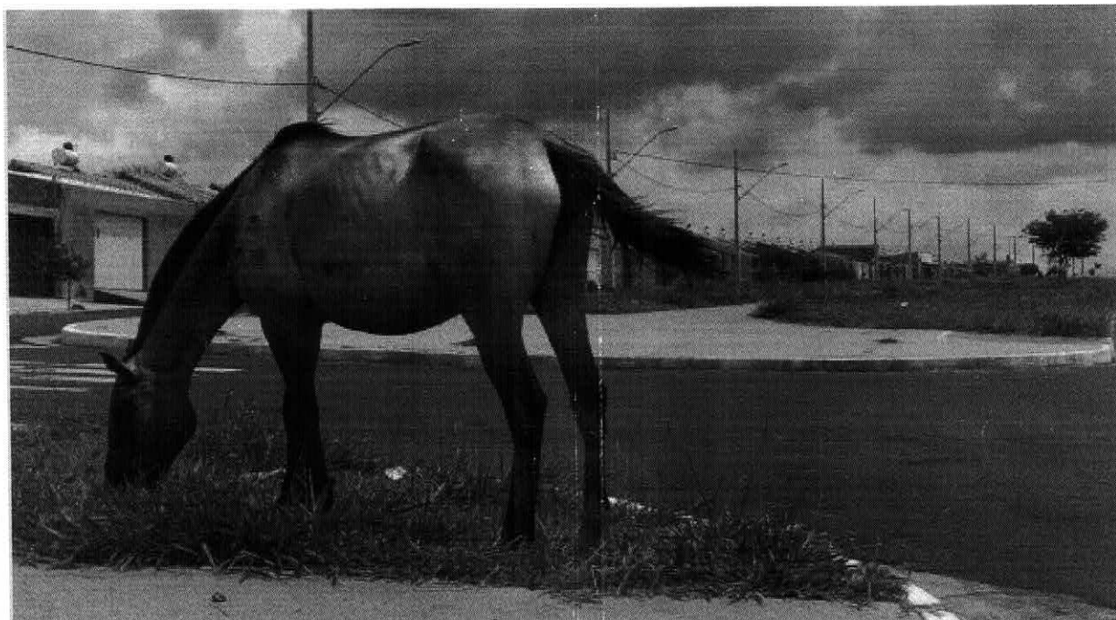
Cavalos soltos no Portal dos Ipês podem causar acidentes