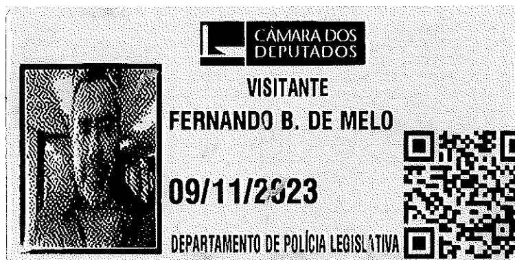
ZÉ VITOR DEPUTADO FEDERAL PL/MG