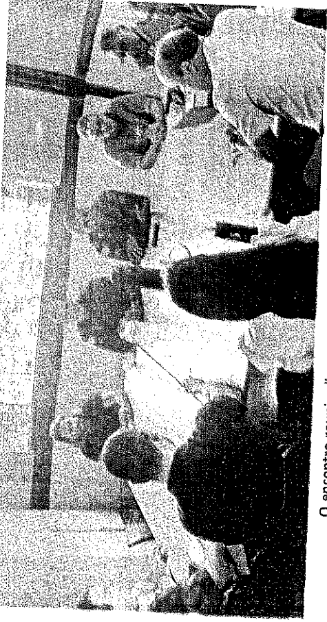
O encontro reuniu diversos setores da administração pública

Com aumento de casos de dengue e chikungunya, o município de Araguari intensifica ações de fiscalização em imóveis e empreendimentos irregulares. Operações conjuntas devem combater focos do mosquito transmissor e prevenir novos casos das doenças.